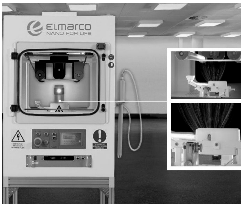
Рис. 1 Внешний вид установки Nanospider LAB

Параметры процесса электроформования: расстояние между электродами – 140 мм; вид используемого электрода – струнный; скорость движения поверхности – 0,1 м/мин; частота вращения электрода – 12 \text{ мин}^{-1} ;